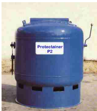
P2 : 2 Kg TNT Poids : 750 kg, D : 1 m H 1.10 m