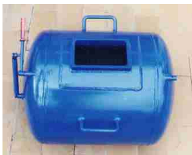
HP0.15 : 150 grammes TNT Poids : 85 kg, 65 x 50 x 57 cm