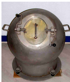
HP0.3 : 300 grammes TNT Poids : 70 kg, diamètre 55 cm