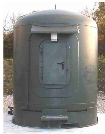
P10SD : 10 kg TNT Poids : 5.5 T, D : 2.3 m, H : 3.15 m