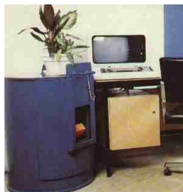
P0.5 : 500 grammes TNT Poids : 350 kg, D 65 cm, H 90 cm