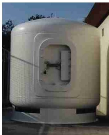
P5 : 5 kg TNT Poids : 3,5 T, D : 2 m , H 2.05 m